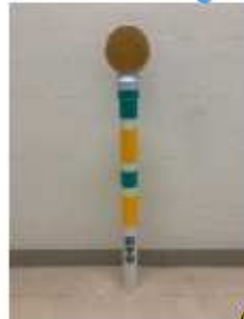
<デリネーター付き> ダブルの反射で 視認性バツグン！